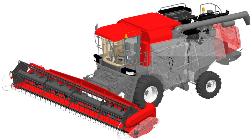
Рисунок 5. Создание 3D модели самоходной сельскохозяйственной машины

Работа с такими системами требует помимо знания предметной области также знаний и умений владеть инструментарием, в качестве которого выступают сложные многофункциональные программные комплексы, основанные на самых современных информационных технологиях.