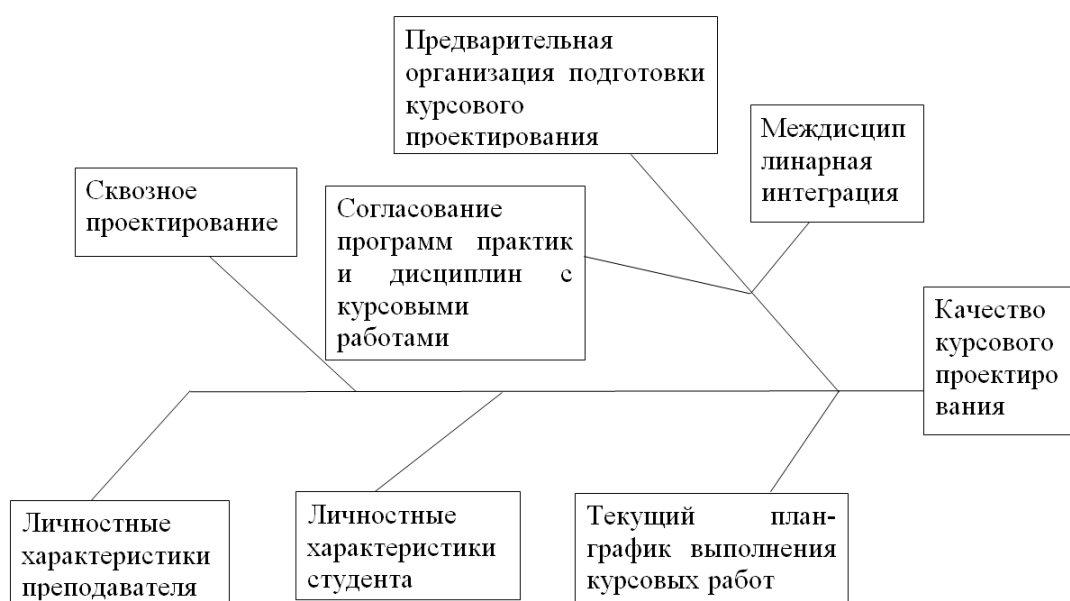
Рисунок 2 – Диаграмма Исикавы проблемы «Качество курсового проектирования»

Причинно-следственная диаграмма Исикавы проблемы «Качество организации курсового проектирования», построенная с учетом анализа проблем курсового проектирования, представлена на рисунке 2.